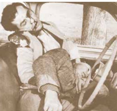
Καβάζογλου-Μιαισούλης, 11 Απριλίου 1964